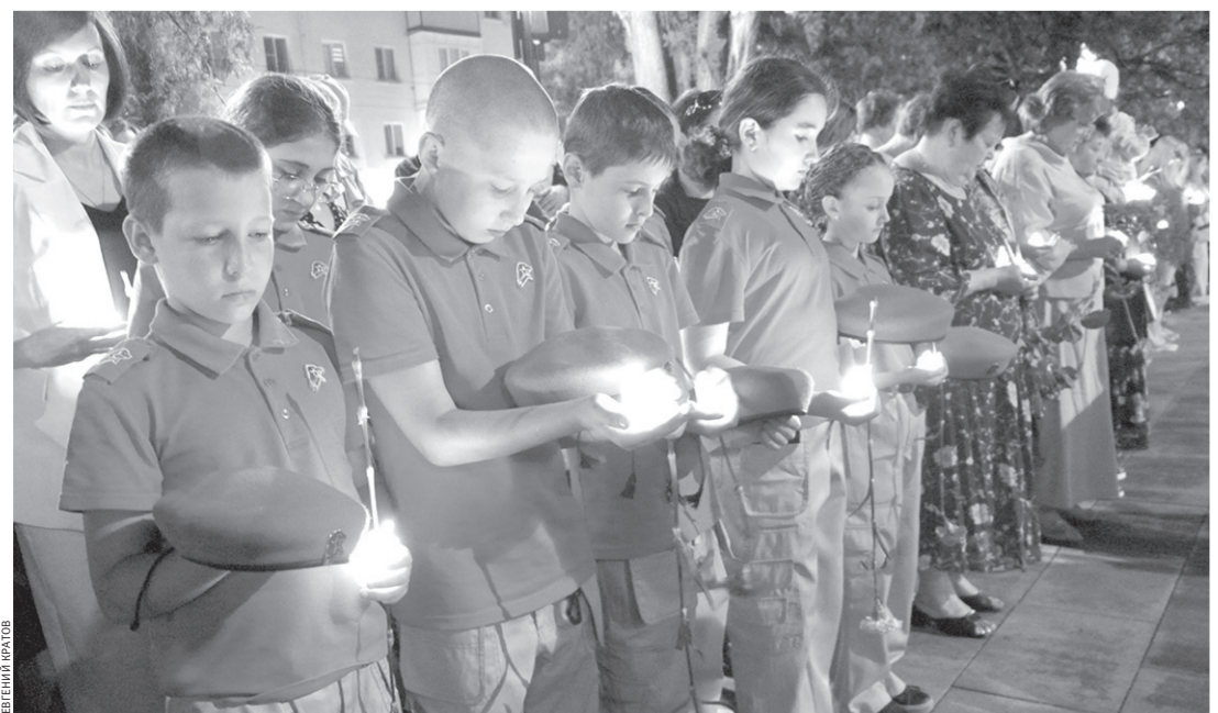
В акции «Свеча памяти» приняли участие и стар и млад