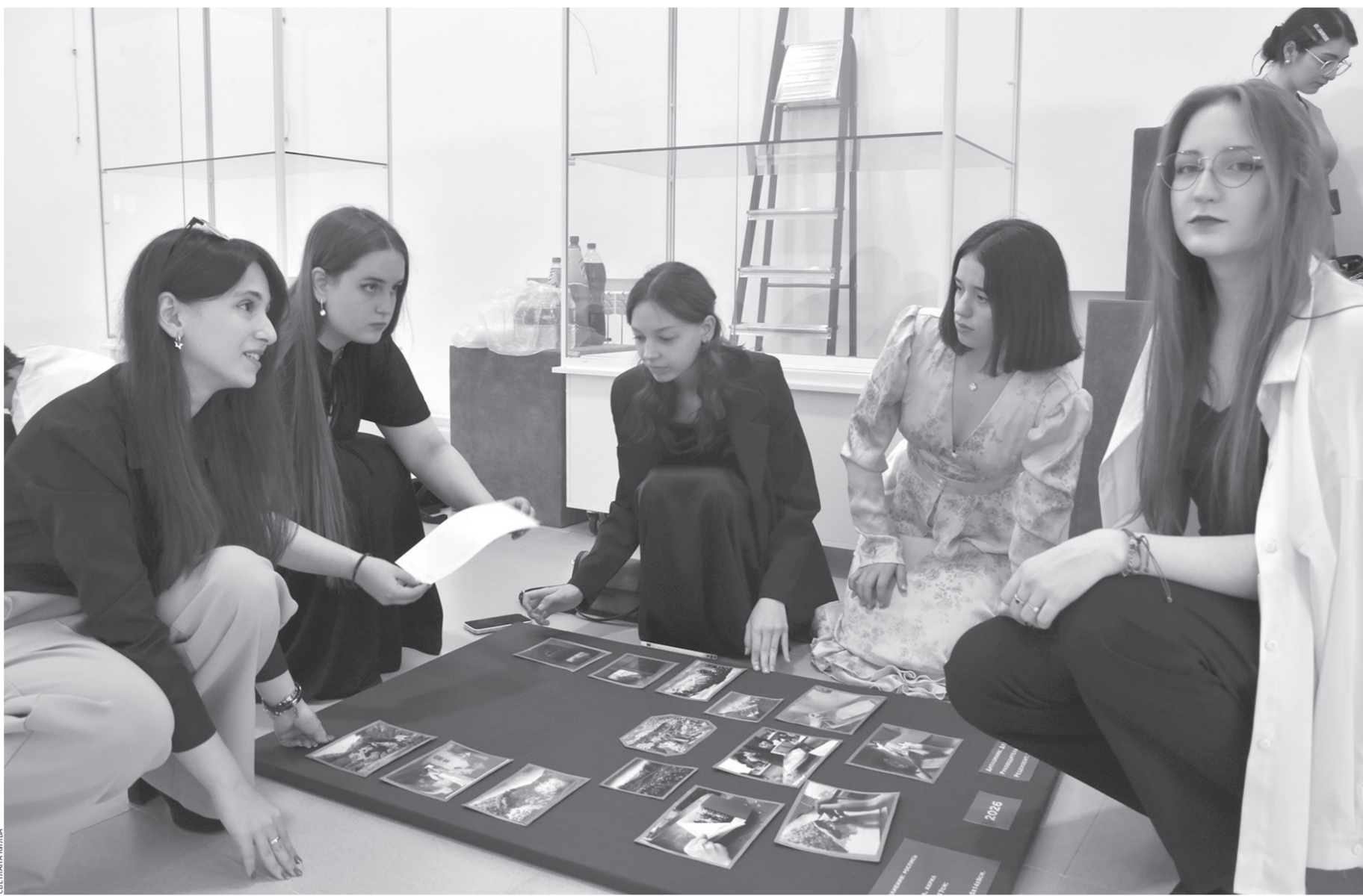
Идет подготовка к защите дипломных работ

Министр призвал выпускников продолжать образование. — Мы готовы помогать: писать рекомендации в вузы и оказывать содействие при поступлении. Обращайтесь в министерство, и мы поможем вам поступить, куда пожелаете. Нам важно, чтобы вы стали профессионалами и, вернувшись, рабо-