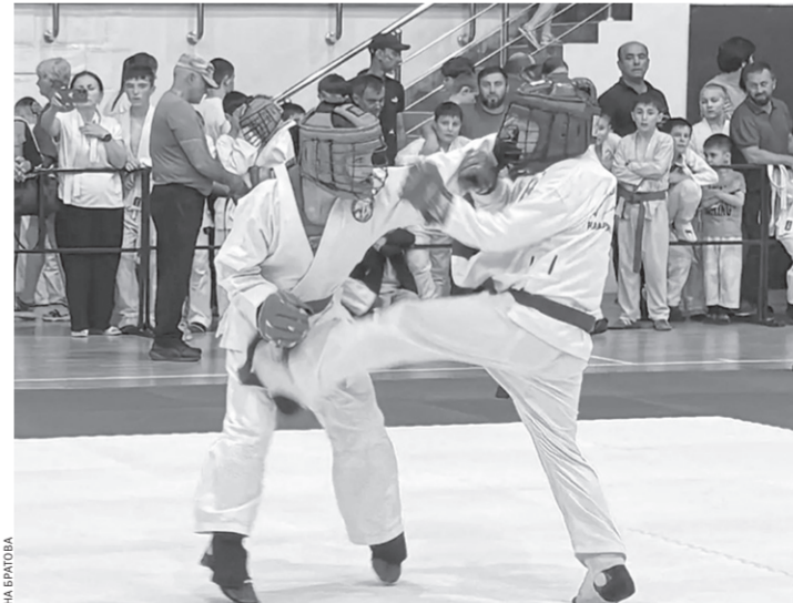
Каждый из бойцов настроен на победу

— Это уже шестые соревнования в нашей республике, для молодежи — это отличная возможность перенять бесценный опыт старших, а зрелье, опытные борцы подзарядились энергией молодых бойцов, — говорит